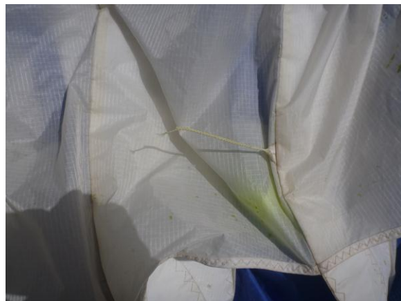
Slika 7. Pokidani konopac