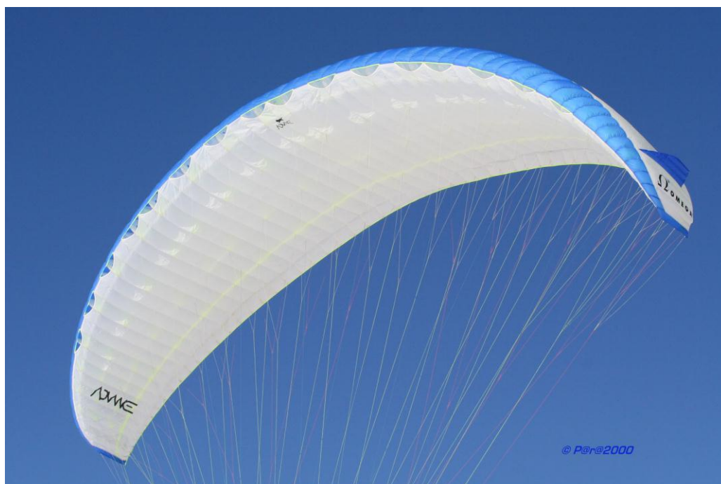
Slika 3. Parajedrilica Advance - Omega 5