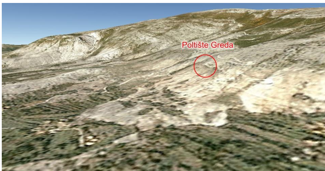
Slika 2. Poletište 'Greda' i okolni teren