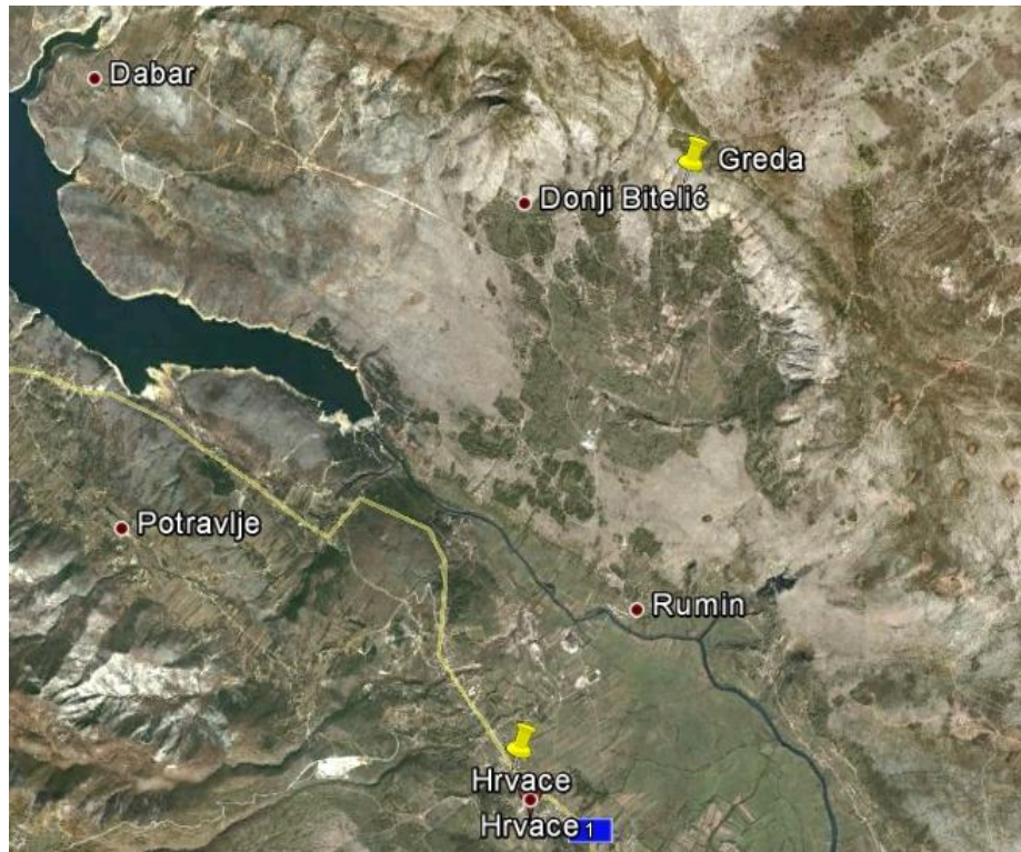
Slika 1. Satelitska slika područja letjelišta 'Greda'

Dana 28.04.2013. oko 17:35 LT, pilot je poletio s poletišta 'Greda'. Odmah nakon odvajanja od tla došlo je do bočnog zatvaranja lijeve strane kupole parajedrilice, uslijed čega se parajedrilica zarotirala ulijevo i pala na padinu neposredno ispod poletišta. Pilot je zadobio višestruke teške tjelesne ozljede.