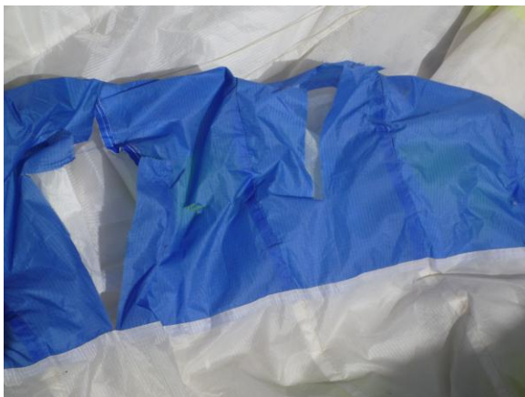
Slika 6. Oštećenja na kupoli

Zbog navedenih znatnih oštećenja, parajedrilica nije mogla biti ispitana u letu. Može se pretpostaviti da je prije pada parajedrilica bila sposobna za letenje. Također, može se pretpostaviti da kategorija parajedrilice nije bila primjerena pilotu koji rijetko leti.