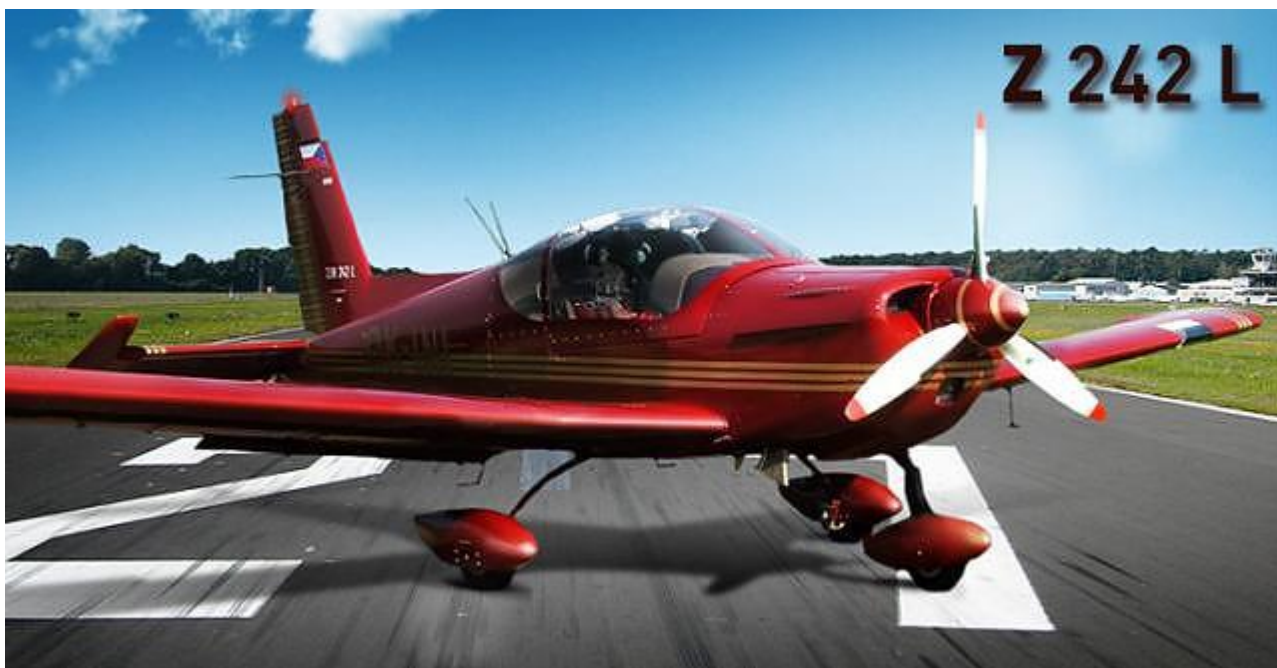
Slika 2. – avion ZLIN 242 L

Proizvođač: Moravan AEROPLANES a.s. Tip: ZLIN 242 L Reg. oznake: 9A-KAM Godina proizvodnje: 1999. Serijski broj: 733 MTOM: 1090 kg Motor: Textron Lycoming A1EO-360-A1B6