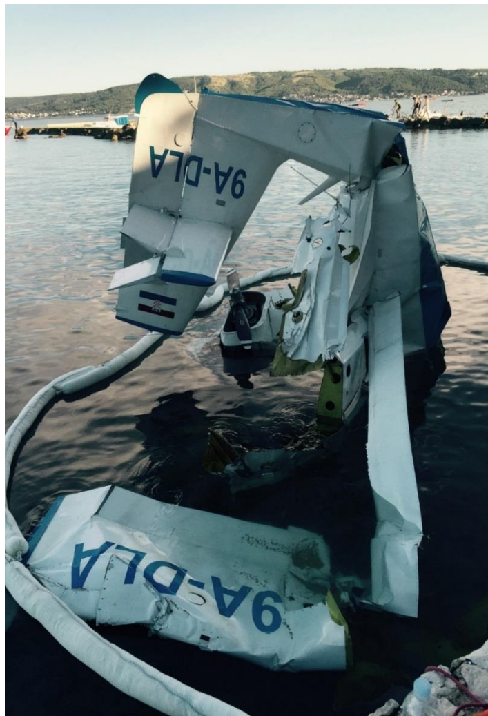
Slika 3. Olupina zrakoplova 9A-DLA na mjestu nesreće

U ovoj je nesreći zrakoplov 9A-DLA potpuno uništen. Avion je pao u plitko more neposredno uz obalu i ostao ležati u vodi dubine oko jedan metar.