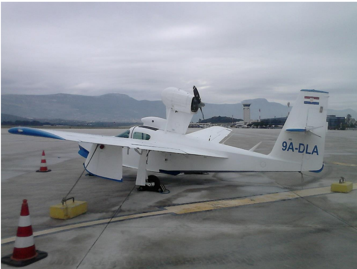
Slika 4. – Zrakoplov LA-4-200 Buccaneer, 9A-DLA

Lake Buccaneer LA-4-200 je zrakoplov amfibija koji spada u kategoriju lakih zrakoplova (MTOW do 2250 kg). Sposoban je primiti pilota i još tri osobe. Konstruiran je za polijetanje i slijetanje na vodene i kopnene površine. Za slijetanje na kopnenu pistu ima uvlačeći stajni trap tipa tricikl. Donja strana trupa oblikovana je za voženje po vodenim površinama te omogućuje polijetanje i slijetanja direktno na trup. LA-4-200 ima jedan motor smješten na konzoli na gornjoj strani trupa, iznad krila. Time je motor dovoljno uzdignut da omogućuje zrakoplovu dodir s vodenom površinom direktno trupom.