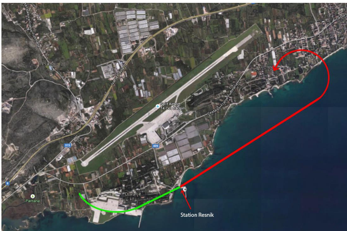
Slika 2. – skica putanje leta 9A-DLA

Temeljem svjedočenja očevica, također pilota, načinjena je skica leta (Slika 2). Dio putanje leta zrakoplova s normalnim radom motora označen je zelenom, a dio putanje nakon prestanka rada motora označen je crvenom bojom. Procijenjena visina zrakoplova u trenutku prestanka rada motora, prema izjavi očevica, bila je 700 – 800 ft (213 – 244 m).