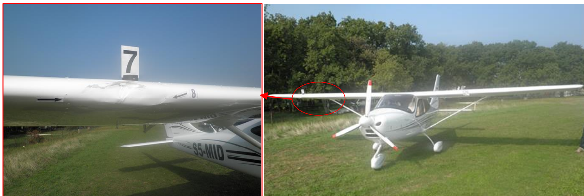
Slika 2. Oštećenja zrakoplova S5-MID

Na zrakoplovu S5-MID utvrđena su mehanička oštećenja na napadnom rubu desnog krila i na donjoj strani desnog krila te na prednjoj strani upornice desnog krila. (Slika 2.)