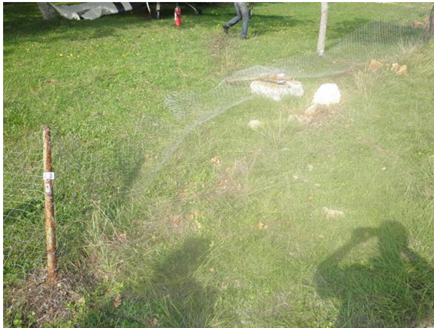
Slika 4. Oštećenja ograde na aerodromu

Zrakoplov OM-M901 je u nastavku kretanja između dva zrakoplova srušio dio zaštitne metalne ograde u duljini od 6 m i tri stupa za učvršćenje.