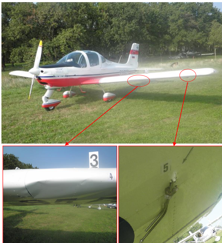
Slika 3. Oštećenja zrakoplova S5-PCO

Na zrakoplovu S5-MID utvrđena su mehanička oštećenja na napadnom rubu desnog krila i na donjoj strani desnog krila te na prednjoj strani upornice desnog krila. (Slika 2.)