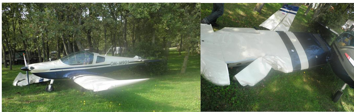
Slika 1. Oštećenja zrakoplova OM-M901

Pregled oštećenja na zrakoplovu OM-M901 obavili su istražitelji AZI.